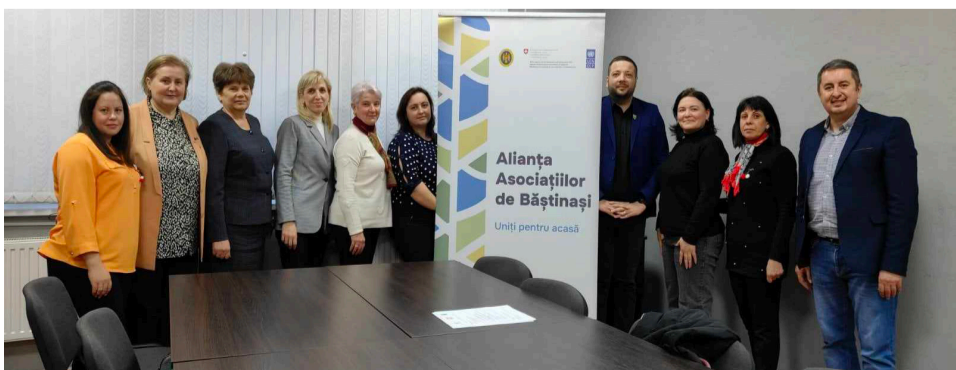
Activitatea de evaluare a Strategiei de dezvoltare locală

Biblioteca Publică Pelinia a devenit un centru comunitar de dezvoltare locală și implicare civică. Aici se organizează activități de instruire a localnicilor, de informare pe diverse domenii, de mobilizare civică a băștinașilor în dezvoltarea locală.